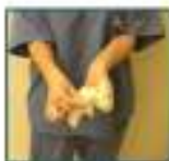
Foto: Camilla (Campe) Castro (CCO) Higienização Manual (MUN) (M) Ministério de Saúde (MS)

179 Remover o par de luvas virando pelo avesso e descartá-lo no resíduo infectante da ante sala.